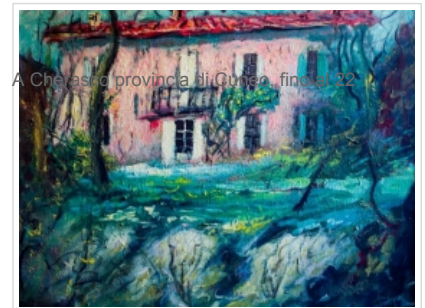
A Cherasco provincia di Cuneo, fine del '22