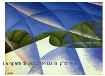
Le opere di Giacomo Balla, pittore e